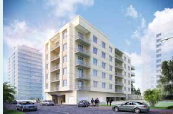
Al Fujairah Endowment