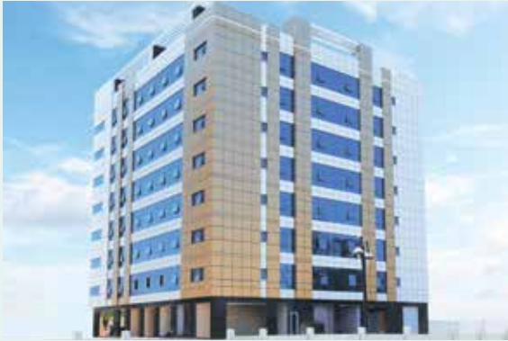
Al Warqa Endowment