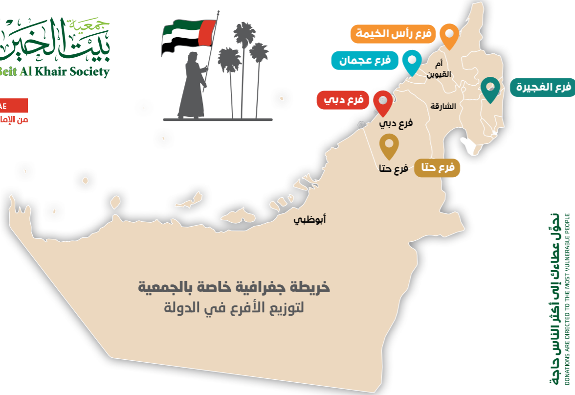
خريطة جغرافية خاصة بالجمعية لتوزيع الأفرع في الدولة